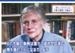
2月16日毎日放送「VOICE」より

ニューヨーク大学のラビッチ教授は「教育基本条例は、アメリカで失敗した『教育改革』と全く内容が同じ。競争と罰で失敗しました」