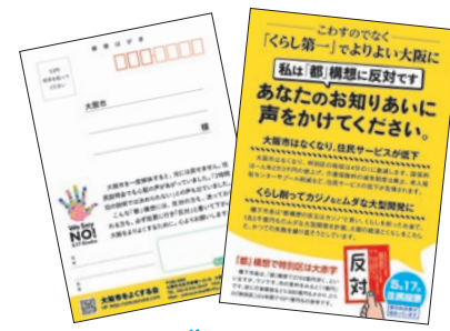
●ハガキ お知り合いの方への訴えに