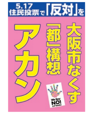
●プラスター 各分野別に7種類