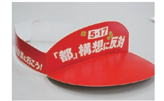
●サンバイザー 日中の宣伝活動に