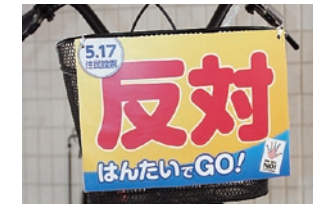
●自転車前カゴ用 自転車のカゴに付けてアピール