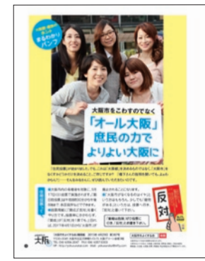
●まるわかりパンフ 「大阪都」構想のホントを 詳しく解説