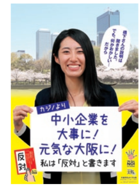
●ポスター 各分野別に6種類