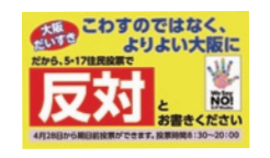
●ミニビラ 手渡ししやすい 名刺サイズ