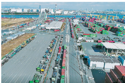
夢洲コンテナターミナルから夢舞大橋方面、渋滞するトラレラー

夢洲は「スーパー中枢港湾」に指定され、中国を中心に、海外コンテナ貨物取り扱い量3億トンを超える物流拠点になっています。20万人もの観光客を運ぶ車両や人の波が物流業者の営業を妨げます。