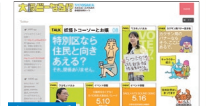
●大阪どーなる!? 「都」構想について考えるサイト