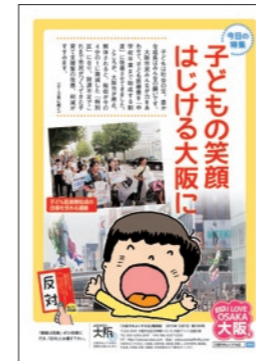
●日刊 Love 大阪 日刊で「都」構想のホントを解説

大阪市をよくする会は、ホームページで、これまでだしたビラやポスターなどの宣伝物、「大阪都Q&A」パンフレット、わかりやすい動画などをアップしています。どうぞご覧ください。