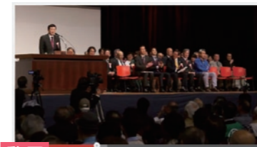
●大阪市なくしたらアカン 4・28府民大集合ダイジェスト 6000人を超える集会の様子をお届け