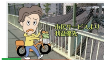
●大阪都構想「5つの偽善」 全5本の解説動画