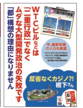
●パネル 各分野別に6種類