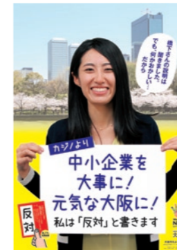
●ポスター 各分野別に6種類