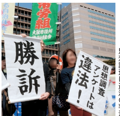
思想調査は違法の判決