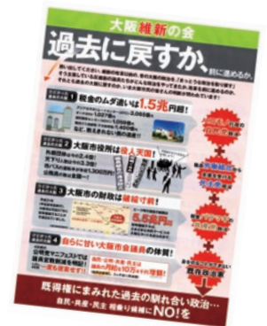
今回もビラでウソを

むしろ、「大阪都」を再びもち出し、カジノなど過去の失敗を再来させようとしている「維新」こそ暗黒時代への後戻りです。