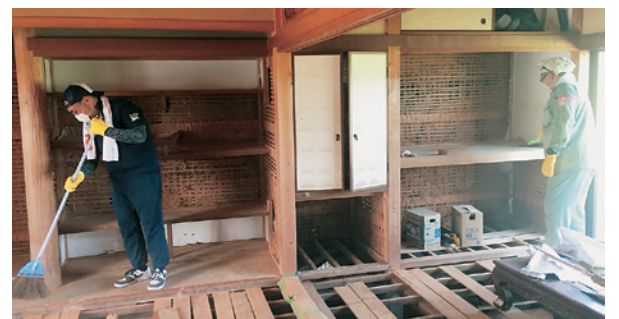
全国からボランティア支援! でも生活再建に程遠く

甚大な災害時に国会で採決強行して成立させたカジノ法に怒りの 声が沸き起こっています。今なお3600人(8月6日現在)が避難所に 身を寄せており、生活再建の道のりは険しい状況におかれています。 「カジノより防災対策を」の声がいつそう高まっています。