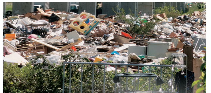
山積みされたままの災害ごみ(岡山県真備町)